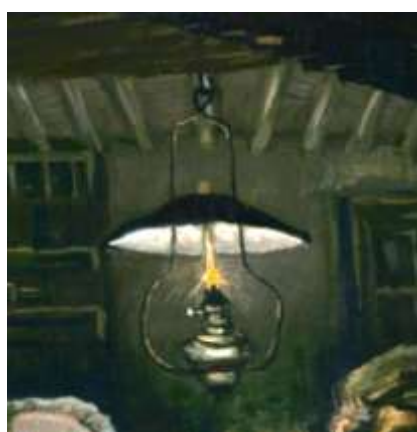
detail uit schilderij De Aardappeleters

We zien dat de famielamp inderdaad sterk lijkt op de olielamp die ook op Vincents schilderij is afgebeeld. Maar de boog van de ophanging loopt overigens niet geheel zoals bij de lamp op het beroemde Nuenense schilderij. Vincents lamp heeft geen ronde boog maar een met een knik vlak onder het reflecterende kapje. Op een ander werk van hem zien we echter een boog die wel wat ronder is, zeker als je aanneemt dat de lamp op het schilderij wat gedraaid hangt: