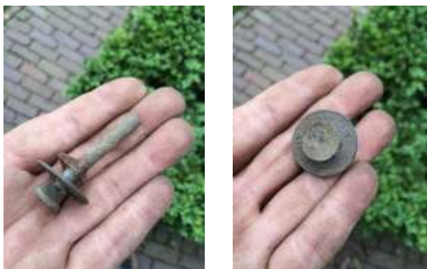
het gevonden onderdeel met daarop de oude fabrieksnaam