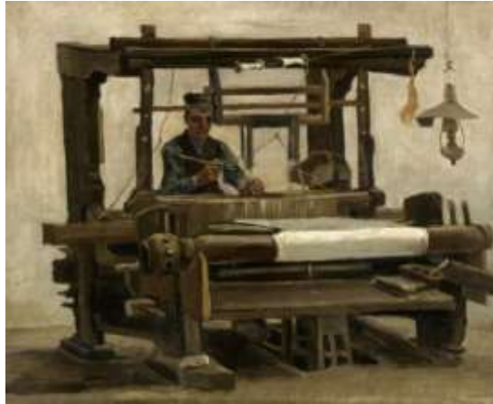
Wever, van voren gezien [JH 479; F 30]