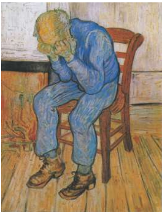
St.-Rémy-de-Provence [JH 1967]

Eerst iets over het ontstaan van dit bijzondere werk. Als Vincent in 1890 in de inrichting in St.-Rémy verblijft, denkt hij steeds vaker terug aan zijn geboorteland, met name Brabant. Omdat hij vaker herhalingen van vroegere werken maakt, wil hij ook nu een oude tekening gebruiken voor een nieuw schilderij. Hij vraagt daarom aan zijn broer Theo om zijn Haagse litho 'At Eternity's Gate' [JH 268; F 1662] uit 1882 op te sturen. Op deze gesigeneerde litho zien we een treurende of biddende man, het moede hoofd in de handen, zittend bij een gedoofd(!) haardvuur. Onderaan heeft Vincent zelf geschreven 'At Eternity's gate'. Dát beeld van een sterveling die moe is van het ploeteren en wacht op eeuwige verlossing, spreekt hem na acht jaar nog steeds aan. Zo ontstaat in mei 1890 het beroemde schilderij met de oude man in het blauw; het werk is in bezit van het Kröller-Müller Museum in Otterlo. Vooral het kleurgebruik is op dat werk vernieuwend.