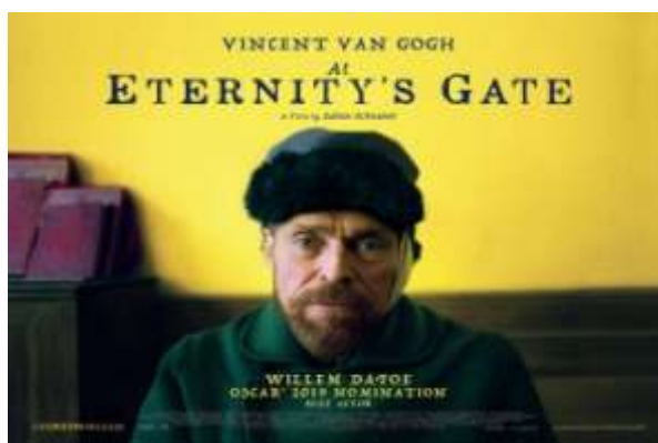
filmposter van de bioscoopfilm At Eternity's Gate , 2019