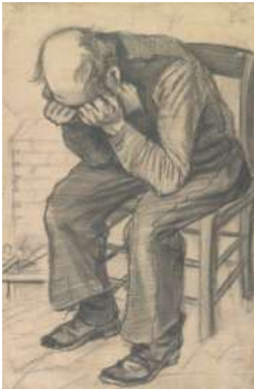
Den Haag [JH 267]

Hij maakte er bovendien nog een los schetsje [JH 35] van dat hij meestuurde in een brief (nr. 172, half september 1881) aan zijn broer Theo.