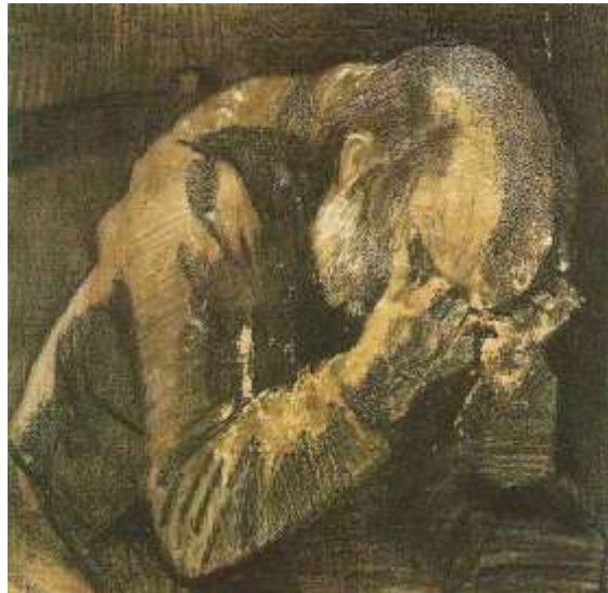
Den Haag [JH 269]