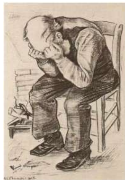
Den Haag [JH 268]

Eerst iets over het ontstaan van dit bijzondere werk. Als Vincent in 1890 in de inrichting in St.-Rémy verblijft, denkt hij steeds vaker terug aan zijn geboorteland, met name Brabant. Omdat hij vaker herhalingen van vroegere werken maakt, wil hij ook nu een oude tekening gebruiken voor een nieuw schilderij. Hij vraagt daarom aan zijn broer Theo om zijn Haagse litho 'At Eternity's Gate' [JH 268; F 1662] uit 1882 op te sturen. Op deze gesigeneerde litho zien we een treurende of biddende man, het moede hoofd in de handen, zittend bij een gedoofd(!) haardvuur. Onderaan heeft Vincent zelf geschreven 'At Eternity's gate'. Dát beeld van een sterveling die moe is van het ploeteren en wacht op eeuwige verlossing, spreekt hem na acht jaar nog steeds aan. Zo ontstaat in mei 1890 het beroemde schilderij met de oude man in het blauw; het werk is in bezit van het Kröller-Müller Museum in Otterlo. Vooral het kleurgebruik is op dat werk vernieuwend.