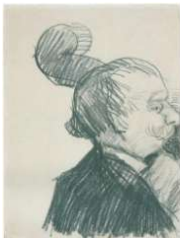
Bassist ( JH 1153)