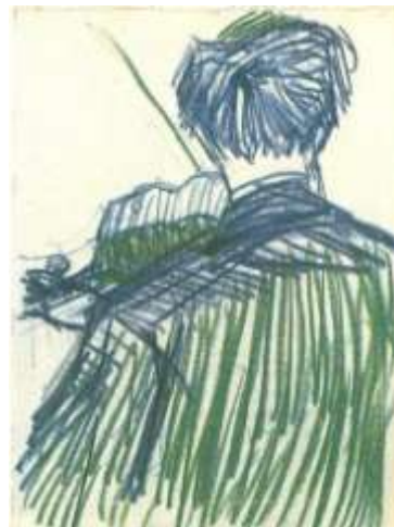
Violist (JH 1154)