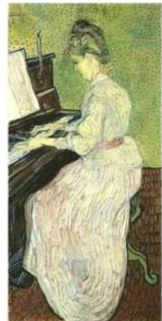
Marguerite Gachet (JH 2048)

Wat weten we van de muzikale interesse en smaak van de schilder Vincent van Gogh? Wat is Van Goghs relatie met de muziek? In zijn picturale werk en zijn brieven zijn enkele directe verwijzingen te vinden naar muziek in het algemeen en naar de muziek van zijn tijd. Vincent heeft in Parijs tekeningen gemaakt van uitvoerende musici, zoals een klarinettist, een violist en een fluitist achter muziekstandaards. Er is een schilderij uit Auvers sur Oise, waar hij de pianospelende dochter van Dr. Gachet heeft geportretteerd. De vraag is wat zij speelde, toen Vincent daar was. Misschien muziek van Erik Satie, een Parijse tijdgenoot van Vincent en evenals hij een miskend genie, die pas na zijn dood beroemd werd?