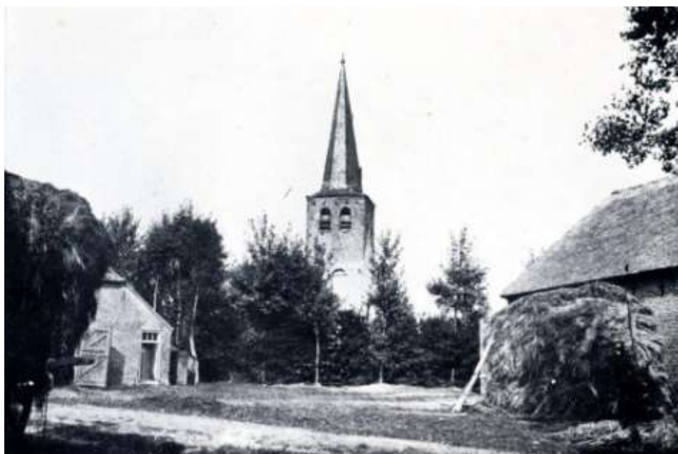
De Kerkhoeve met oude toren, foto uit Nuenen c.a. in oude ansichten