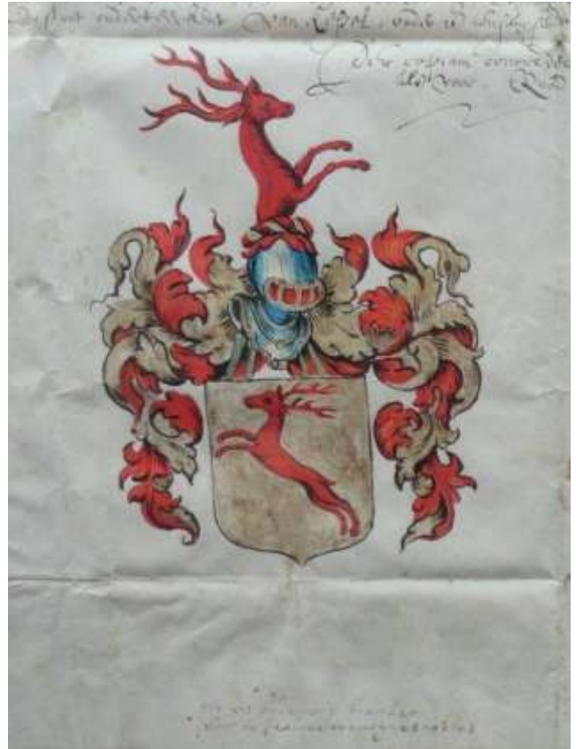
Wapen van de familie De Cort/Kort

Het lijkt daarom niet vreemd dat de toenmalige bewoner, om welke reden dan ook, het springende dier op een bord boven zijn voordeur heeft afgebeeld. En dat Vincent dat bord heeft overgenomen op zijn aquarel van de houtverkoop.