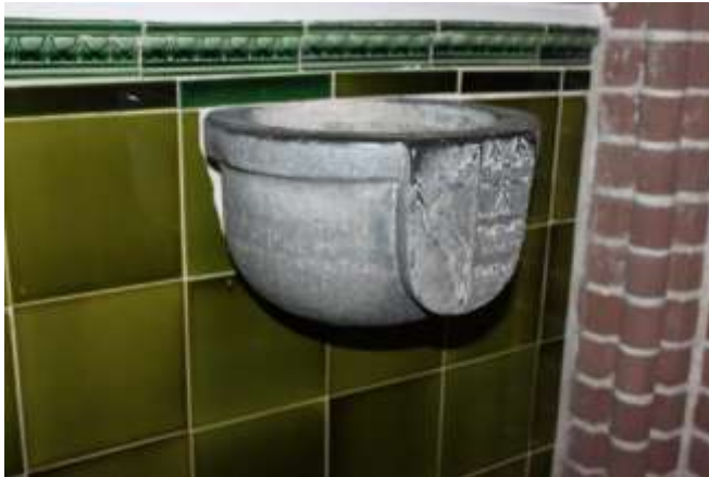
Het wijwatervat met het springend hert in de kerk van Nederwetten

Toen op 13 december 1895 de nieuwe Lambertuskerk in Nederwetten is betrokken, werd in het voorportaal dat hardstenen wijwatervat, afkomstig uit de oude kerk, ingemetseld. Het vat is daar nu nog te vinden.