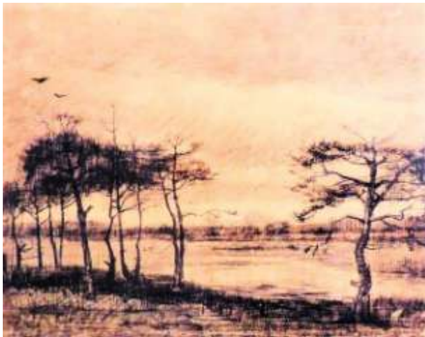
Mastbomen in het ven (JH 473)

Ik neem niet aan dat de aquarel ' Houtverkoop ' gemaakt is bij of naar aanleiding van deze openbare houtverkoop op 28 december 1883. Nog afgezien van de stijlkenmerken ( too detailed and finished to be an 'impression' ) lijkt het ook niet aannemelijk dat Vincent zo snel na zijn aankomst op 5 december 1883 al vanuit Nuenen in dit afgelegen Tongelrese natuurgebied is geweest om daar te schetsen.