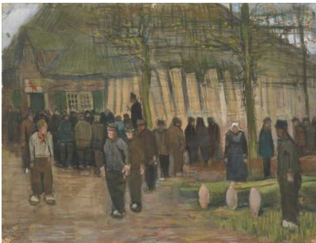
Aquarel 'Houtverkoop' (JH 438)

Samen met een Vincentre-collega werk ik al enige jaren aan een internetsite 1 die locaties in Europa op de kaart zet waar Vincent van Gogh gewerkt, gewoond en verbleven heeft voor zover die plek van belang is geweest voor zijn leven of zijn ontwikkeling als kunstenaar. Met name het onderdeel 'schilderlocaties' toont veel plekken waar je nu nog kunt zien wat Vincent in zijn tijd zag, toen hij daar een schilderij of een tekening maakte. In dat licht is er een Nuenense aquarel van Vincent van Gogh die onze aandacht al een hele poos vasthoudt. Wij vragen ons af waar Vincent deze waterverftekening van een openbare houtverkoop in Nuenen gemaakt kan hebben. Nu heb ik op basis van argumenten het sterke vermoeden dat deze locatie in Nederwetten is te vinden!