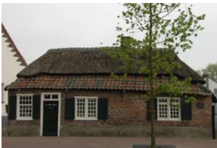
wevershuisje, Nuenen 1763

Overall in Nuenen kwam Vincent wevers tegen. Op veel plaatsen in Brabant en ook in Nuenen vonden mensen hun beroep als wever. In de Nuenense jaren van Vincent waren hier op een totaal van 1318 mannelijke inwoners 440 wevers in dat ambacht werkzaam en ook nog een 40-tal kinderen 3 . Het ambacht werd in Nuenen in hoofdzaak thuis uitgeoefend, vaak in een kleine donkere ruimte waarin een eikenhouten weefgetouw stond. De wevers werkten hier van de vroege ochtend tot de late avond, vaak tegen een karig loon. Slechts één van die vele wevershuisjes bestaat nog: het kosters- of wevershuisje aan de Berg 40, niet ver van zijn ouderlijk huis. Het is waarschijnlijk gebouwd in 1763 of eerder en het geeft een goed beeld hoe de kleine huisjes van de Nuenense thuiswevers er uit zagen.