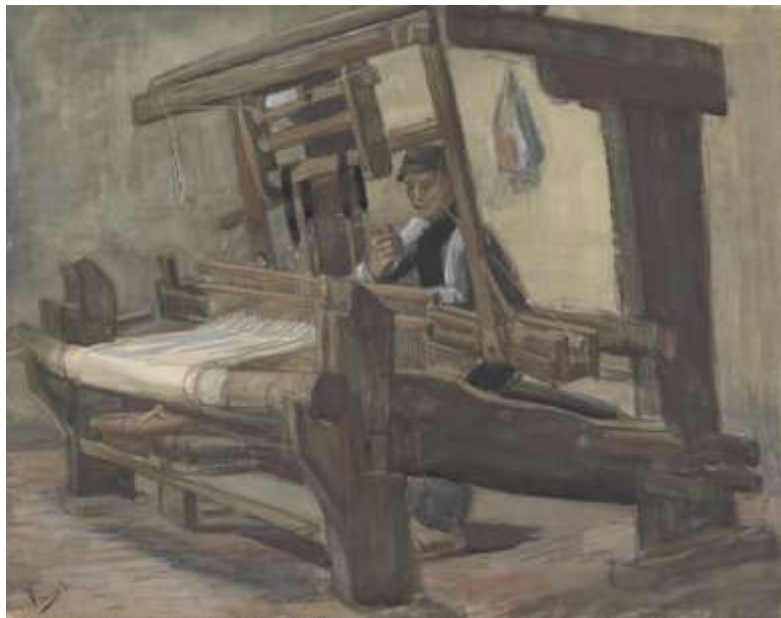
Wever, naar links [JH 444], januari 1884