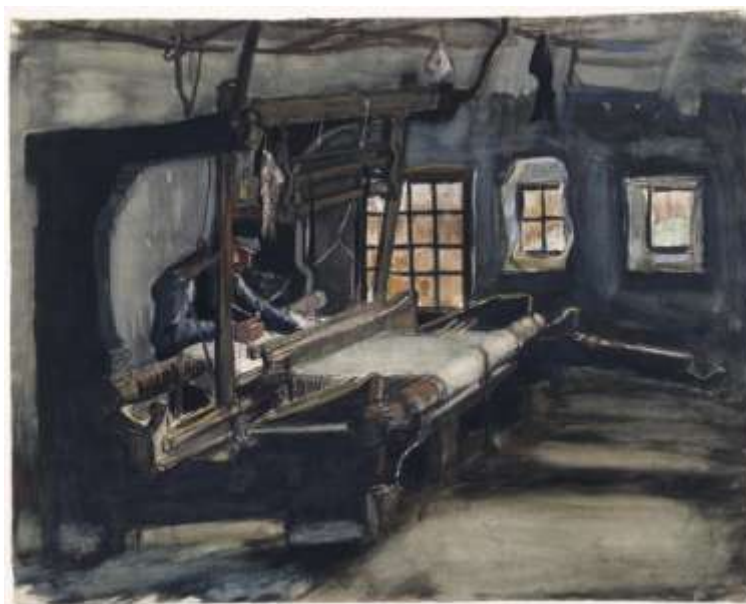
Wever, interieur met drie raampjes [JH 503], juni 1884