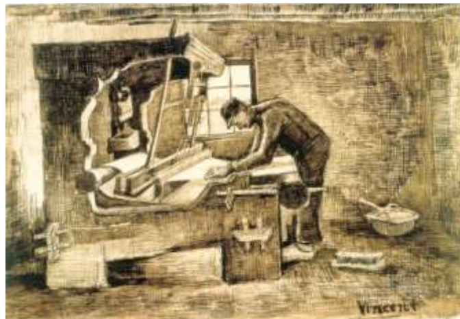
Wever, de draden in orde brengend [JH 481], mei 1884

En hoewel er "....dan ook dikwijls iets gejaagds en onrustigs (is) in de lui" vindt Vincent het toch maar vreemd dat "de lui stil (zijn)" en dat hij "letterlijk nergens (iets) hoorde (...) wat naar oproerige redematies geleek." Hier spreekt een sociale belangstelling van Vincent voor de arme, hardwerkende wevers in Nuenen.